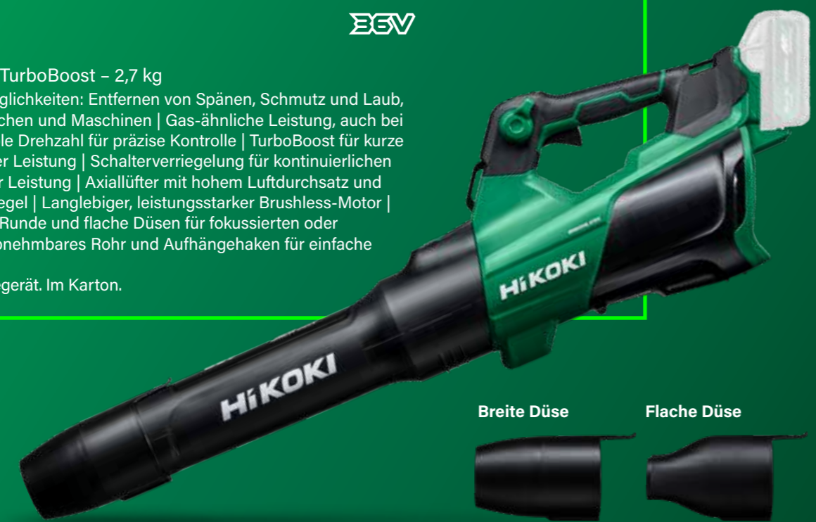
Breite Düse Flache Düse

RB36DC E3V Akku-Gebläse 36 V - 19,8 m³/min TurboBoost - 2,7 kg Vielseitige Einsatzmöglichkeiten: Entfernen von Spänen, Schmutz und Laub, Reinigen von Oberflächen und Maschinen | Gas-ähnliche Leistung, auch bei nassem Laub | Variable Drehzahl für präzise Kontrolle | TurboBoost für kurze Impulse mit maximaler Leistung | Schalterverriegelung für kontinuierlichen Betrieb mit maximaler Leistung | Axiallüfter mit hohem Luftdurchsatz und geringem Geräuschpegel | Langlebiger, leistungsstarker Brushless-Motor | Kompakt und leicht | Runde und flache Düsen für fokussierten oder breiten Luftstrom | Abnehmbares Rohr und Aufhängehaken für einfache Aufbewahrung. Ohne Akkus und Ladegerät. Im Karton.