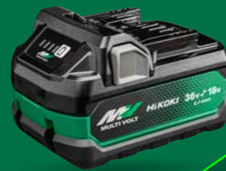
BSL36A18X (18V 5,0 Ah - 36V 2,5 Ah)